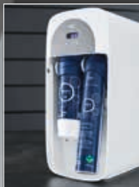
Bombola di CO 2 e filtro alloggiati nell'unità centrale