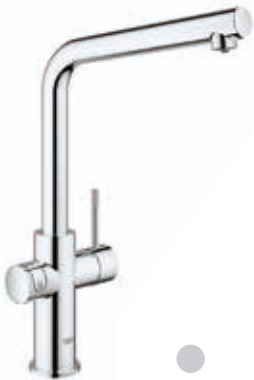
120 832 Rubinetto 2in1 con sistema filtrante dell'acqua bocca L

120 833 Versione con doccetta estraibile