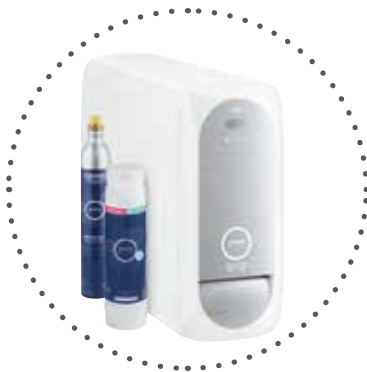
Refrigeratore GROHE Blue Home