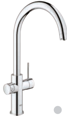
115 556 Rubinetto 2in1 con sistema filtrante dell'acqua bocca C

120 833 Versione con doccetta estraibile